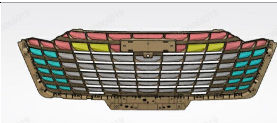
Conjunto – HEV/PHEV